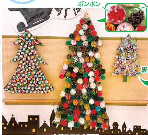
クリスマスの壁画