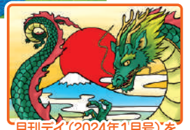
月刊デイ(2024年1月号)を参考に制作

弊誌のぬり絵がすてきな壁画になり、感動しました。お花紙をなびかせるように貼ったたてがみや、ごつごつした質感が伝わる顔のパーツなど、随所に工夫が感じられます。